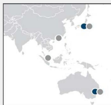
● Funds and Advisory のオフィス