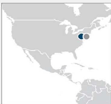
● 国内ファンド・プラットフォーム