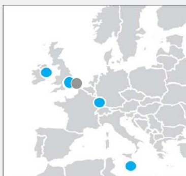
● UCITS ファンド・プラットフォーム